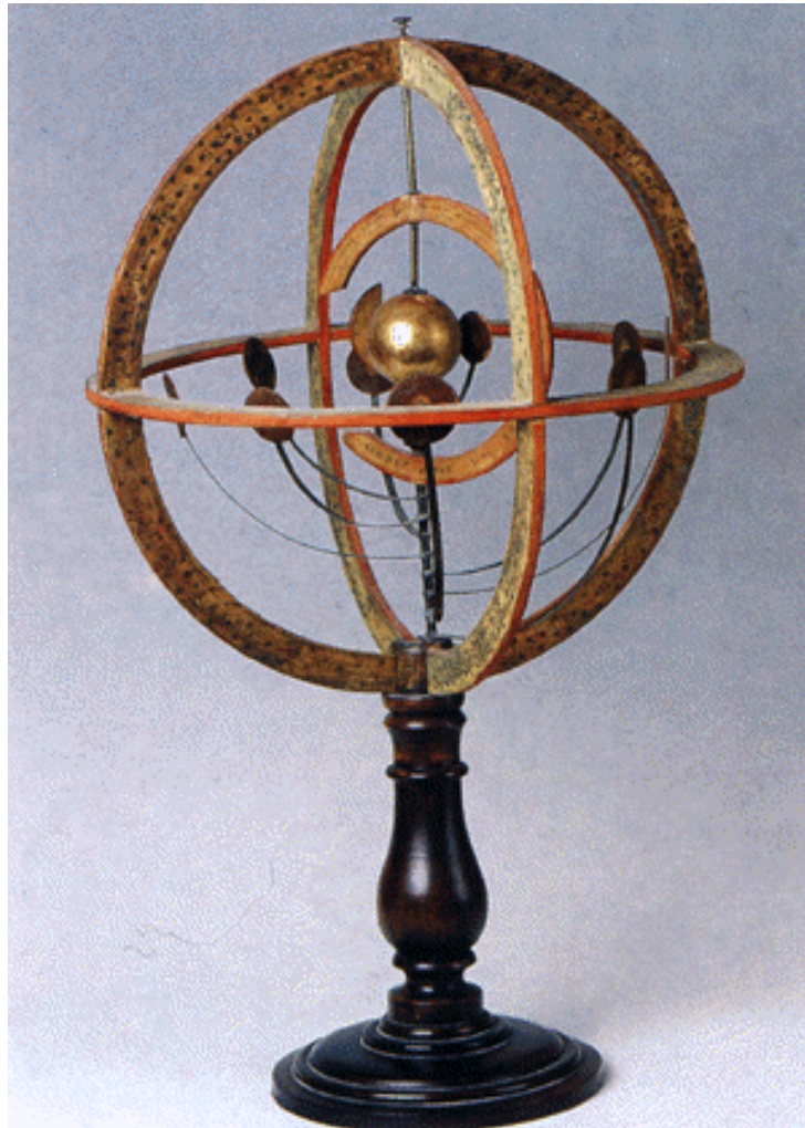
Planetario di Giuseppe Porcasi (Osservatorio Astronomico di Palermo-INAf)